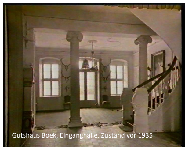
Gutshaus Boek, Eingangshalle. Zustand vor 1935

Gertrud von le Fort wandte sich zunächst nach Heidelberg, ließ sich dann in der Nähe von München und schließlich in Oberstdorf