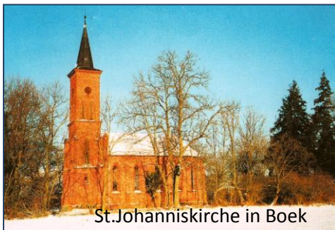
St.Johanniskirche in Boek