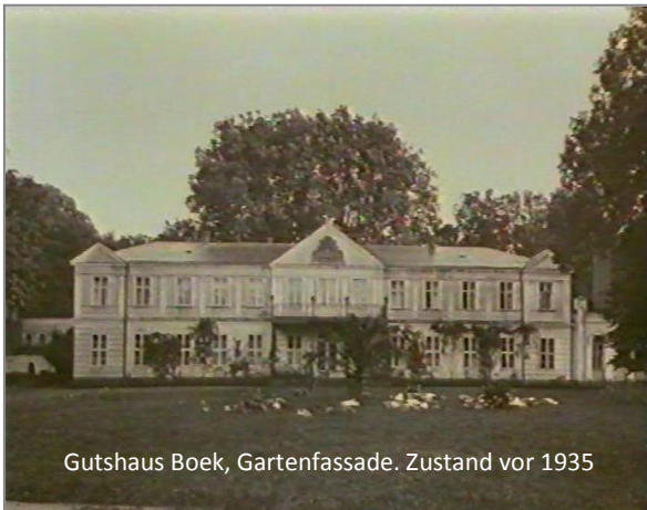
Gutshaus Boek, Gartenfassade. Zustand vor 1935