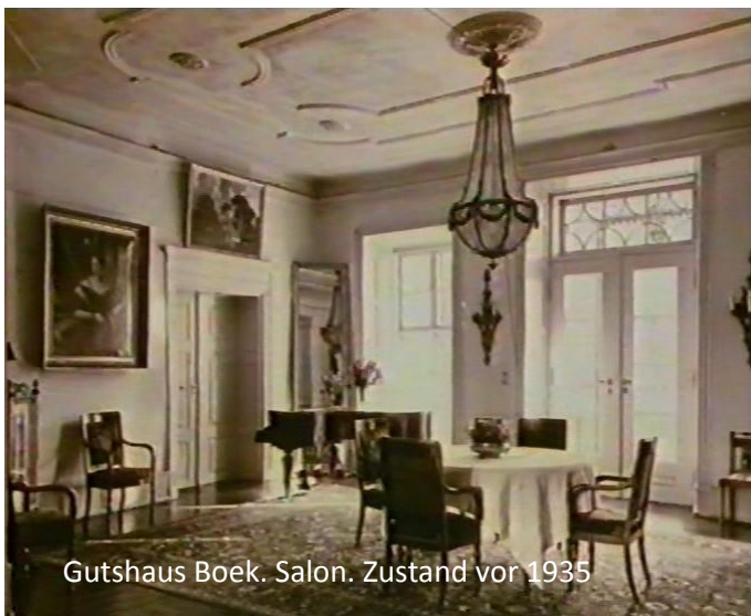
Gutshaus Boek. Salon. Zustand vor 1935